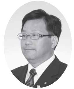
眞野 和久 議員