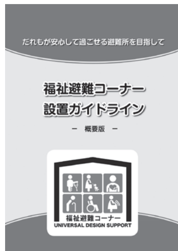
▲福祉避難コーナー設置ガイドライン概要版(京都府)

こうした地区行事は、住民のコミュニケーションを図る上でも、市が掲げる市民参加のまちづくりということでも大切なものだ。継続していきけるよう市の丁寧なサポートが必要ではないか。