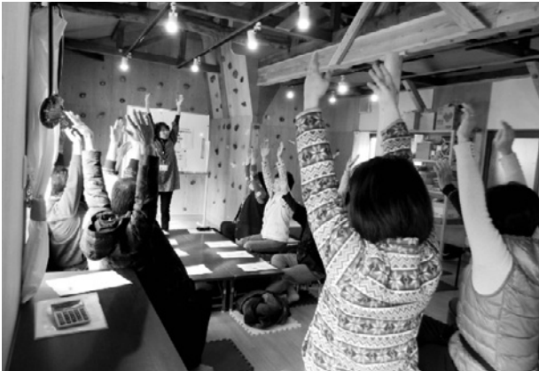
▲高齢者サロンで体操(市民団体主催)