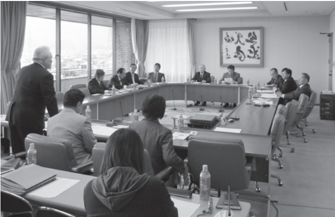
▲議会運営委員会視察