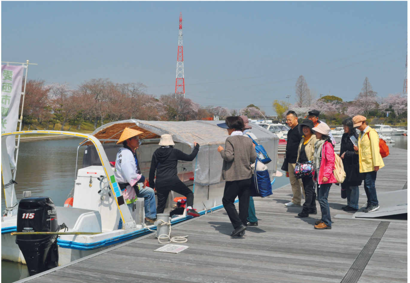
今年も観光船の運行が始まりました。