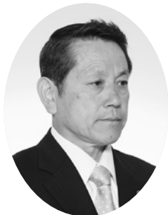
神田 康史 議員