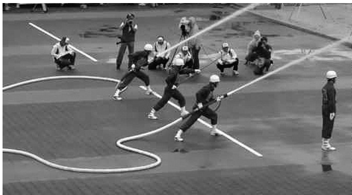
▲支え合い共生社会の確立を