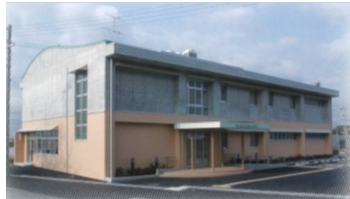
八開地区コミュニティセンター