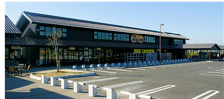
立田ふれあいの里

「立田ふれあいの里」や森川花はす田を含めた周辺地域を観光拠点として整備を推進するにあたって、整備手法の検討及び基本計画図の作成を行います。