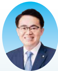
愛知県知事 大村 秀章

新年あけましておめでとうございます。皆様には健やかに初春を迎えられたこととお慶び申し上げます。 昨年、愛知県におきましては、ジブリパークの基本デザイン公表や第20回アジア競技大会の開催都市契約締結、杉原千畝氏の人的功績を後世に伝えるセンポ・スギハラ・メモリアルオープンなど愛知の発展に向けた未来へ続く取組が進められました。 今後、東京2020オリンピック・パラリンピック競技大会、2026年の第20回アジア競技大会、2027年のリニア中央新幹線開業などのプロジェクトが控えております。これらの節目の年をめぐり、愛知県が更なる飛躍を果たすとともに、愛西市が継続的な発展を続けていくためには、時代の潮流に的確に対応していくことが重要となります。 その中でも、住民の皆様の安全・安心の確保は今後の本市発展の大きな課題であります。こ