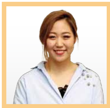
JAPAN CUP 2018 チアリーディング 日本選手権大会