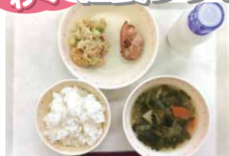
◆ご飯 ◆牛乳 ◆鶏肉の照り焼き ◆干草和え

食育ポイント♪ ・出汁と春菊が香る上品な吹き寄せ汁です。 ・春菊には、ビタミンやミネラルが豊富に含まれており、免疫力を高めてくれるため、この時期にぴったりの食材です。