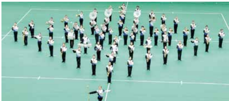
佐織中学校 吹奏楽部