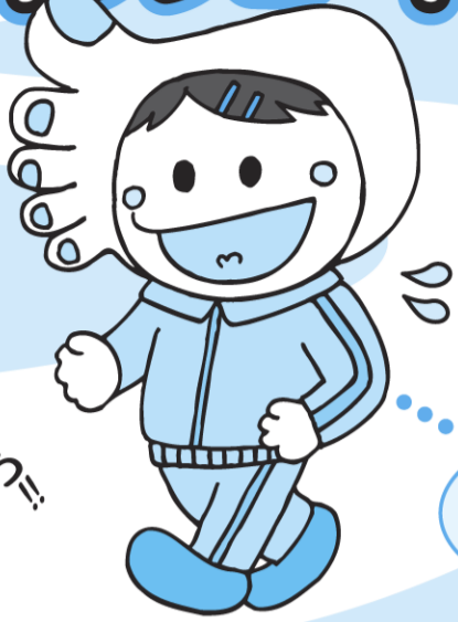
きらり☆あいさい21 運動キャラクター 「あるこちゃん」