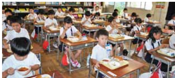
▲給食の様子(勝幡小学校)

A 給食費を負担してもらっていない場合は、病気やアレルギーなどによる場合と同様に対応する。