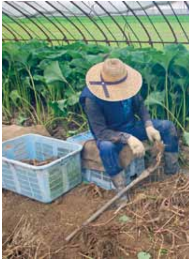
▲フキ農家の根掘り作業

Q 対象者の認定農業者、認定農業者に準ずる者とそれ以外の農業従事者の違いは。 A 市の農業経営基盤強化の促進に関する基本的