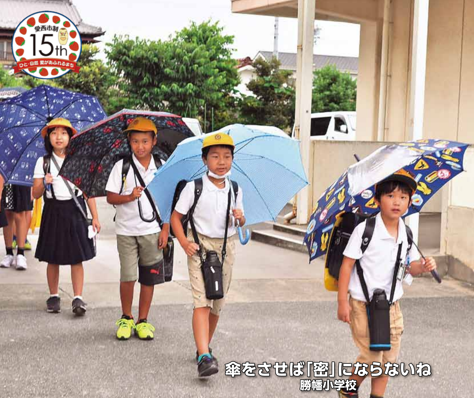
傘をさせば「密」にならないね 勝幡小学校