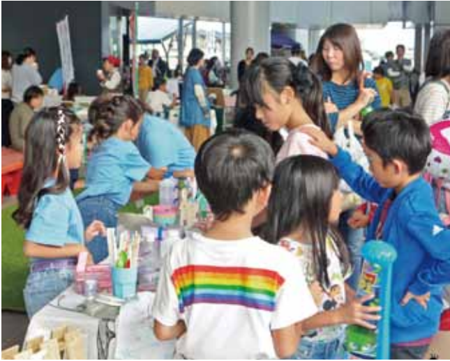
▲にぎわう「あいさいさん祭り」

Q 参加者の年齢層は。 A 10から20代34.7%、30から40代26.9%、50代7.8%、60代11.1%、70代19.1%。