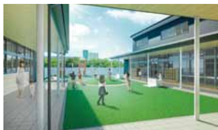
▲児童発達支援センターのイメージ図

障害児や発達に気がかりな子どものライフステージに沿った、切れ目のない一貫した支援や、関係機関との連携を促進するために、児童発達支援センターを石田町に設置します。