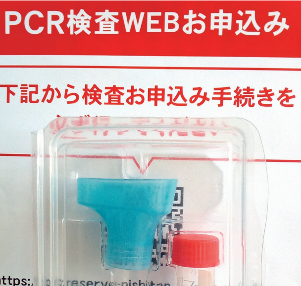
▲高齢者施設に送付されたPCR検査キット

介護従事者は、サービスを継続する必要がある、高齢者同様に一刻も早い接種完了に繋げたい。