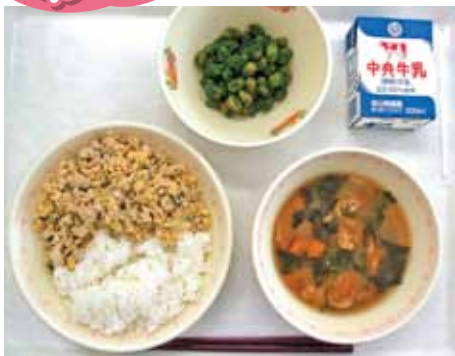
◆名古屋コーチン二色丼 ◆牛乳 ◆あかもく入りみそ汁 ◆抹茶大豆