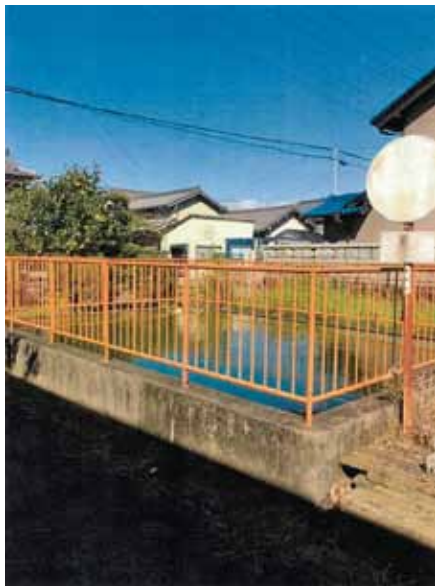
▲41人名義で農地のままの防火水槽

問 市の行政財産に個人の土地と所有者不明土地が何筆あるのか。 答 個人所有が195筆、所有者不明は32筆だ。