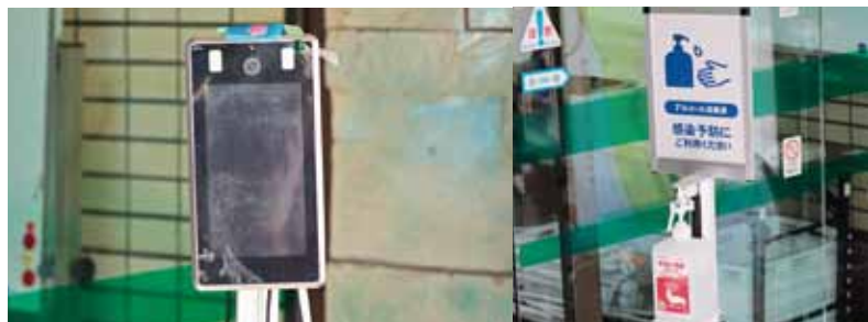
◀体温測定器と消毒液 (佐屋保健センター)