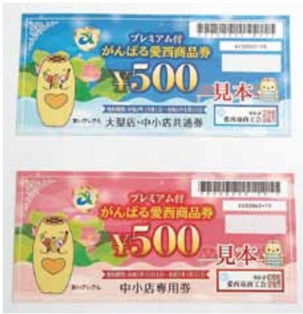
▲プレミアム付商品券 上:大型店・中小店共通券 下:中小店専用券