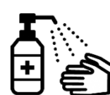
手指消毒用アルコール による消毒の励行

新型コロナワクチンの有効性・安全性などの詳しい情報については、厚生労働省ホームページの「新型コロナワクチンについて」のページをご覧ください。