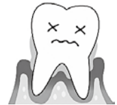
(%) 年齢別の進行した歯周病になっている人の割合