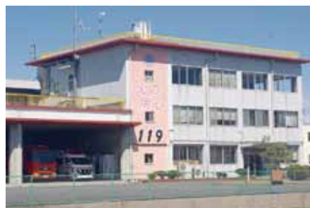
▲改修される消防庁舎