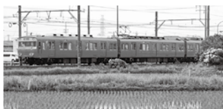
(図録) 佐屋駅近郊を走る名鉄尾西線

このように、JR中央西線、名鉄尾西線、長良川鉄道など、鉄道の発展史からも河川と人の関わりを感じさせます。今年の夏休みには、鉄道の旅を見直してみまじょう。