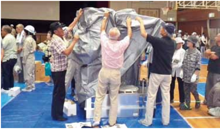
▲組み立て式トイレの組み立て訓練

市の防災力向上のためには地域の皆さんの自主的な防災行動(自助)や地域住民同士の助け合い(共助)が大きな力となります。