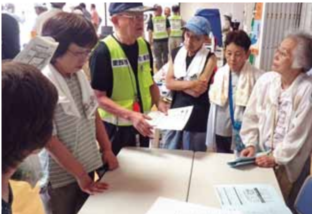
▲避難所ルールの作成

なお、感染拡大防止のため規模を縮小し、西川端地区を対象に行う予定です。今年度は当日の一般参加はできませんが、防災ハンドブックなどを活用し、各ご家庭で防災について話し合います。