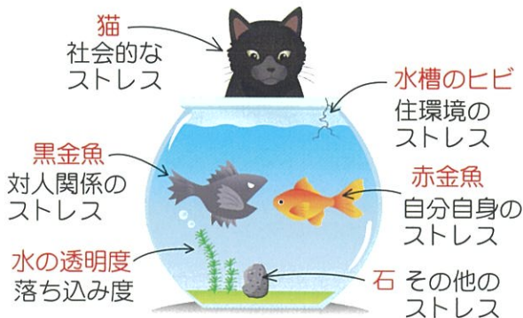
本人モード 結果画面 (例)

ご本人の健康状態や人間関係、住環境などの ストレス度や落ち込み度が、水槽の中で泳ぐ 金魚などの絵になって表示されます。