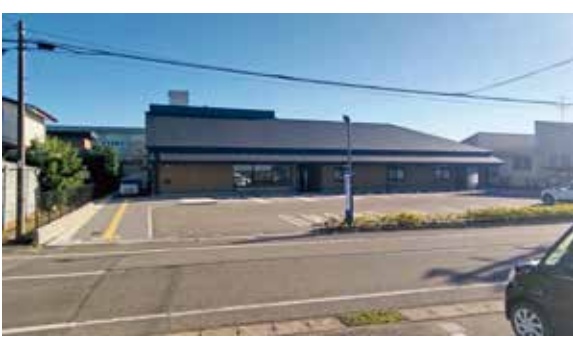
▲令和4年7月に開所した発達支援センター