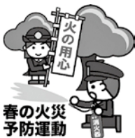
春の火災予防運動